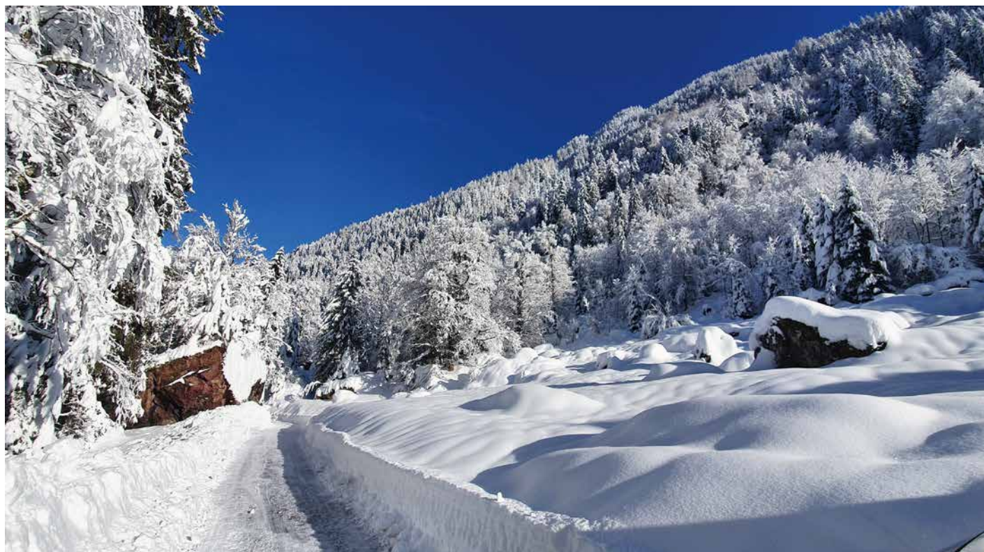
Hinterschwendli Januar 21