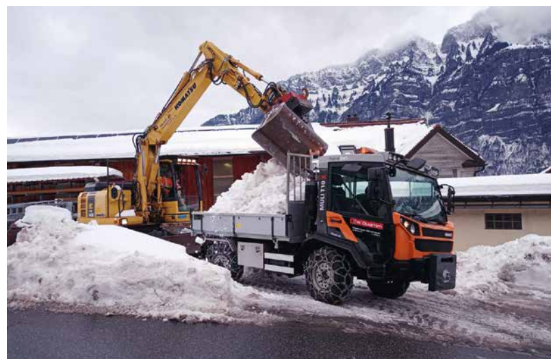
Netzfahrzeug im Winterdienst