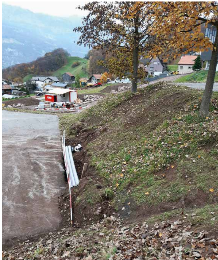
Verkabelung Lufag PP und Erschliessung Himpetütsch