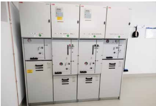
nachher / neu