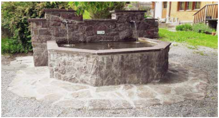
Dorfbrunnen Quarten nach der Sanierung