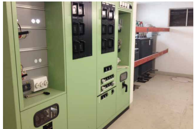
vorher / alt