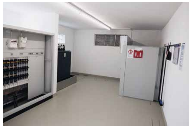
nachher / neu