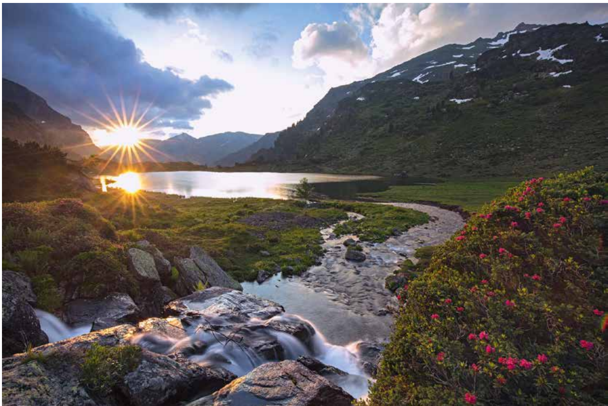
Sonnenaufgang beim Mittlerer Murgsee

Leasingverbindlichkeiten und Verpflichtungskredite sind keine vorhanden.