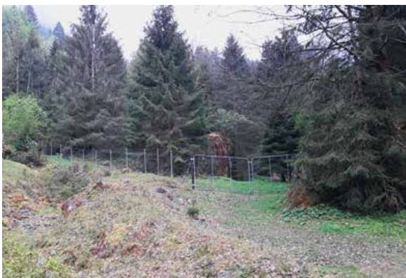
Einzäunung der Quellfassung Chrümmelbach