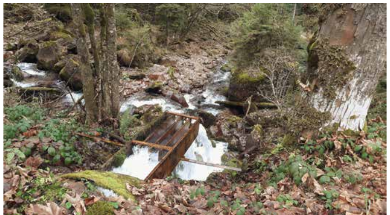
Überlauf Quellfassung Chrümmelbach