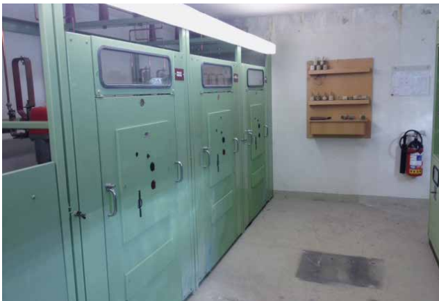
vorher / alt